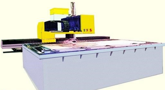
● 懸臂式加砂水刀切割機 Cantilever Cutting System

加砂水刀可切割幾乎任何種類之材料，包括石材，玻璃，陶瓷，橡膠，塑料和複合材料，切割厚度可達 200mm 。由於切割不產生熱效應，所以沒有二次加工。