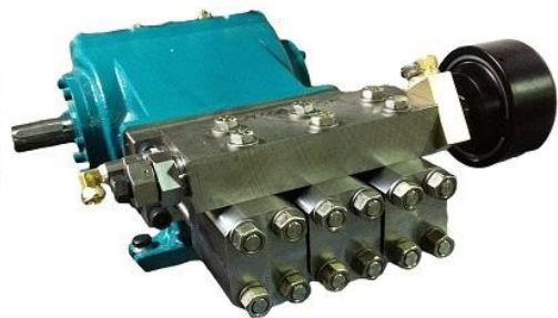
曲軸傳動高壓幫浦

傳動效率達 95 % 以上，適用於切割與清洗設備。高壓零組件皆由美國進口，品質有保障。