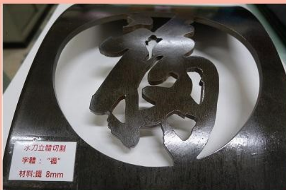
8mm 弧板 - 字型切割 - 3D