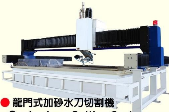
● 龍門式加砂水刀切割機 Gantry-type Cutting System